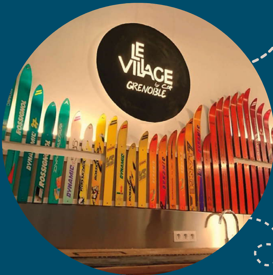
Installation de l'enseigne