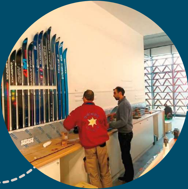
Pose des skis