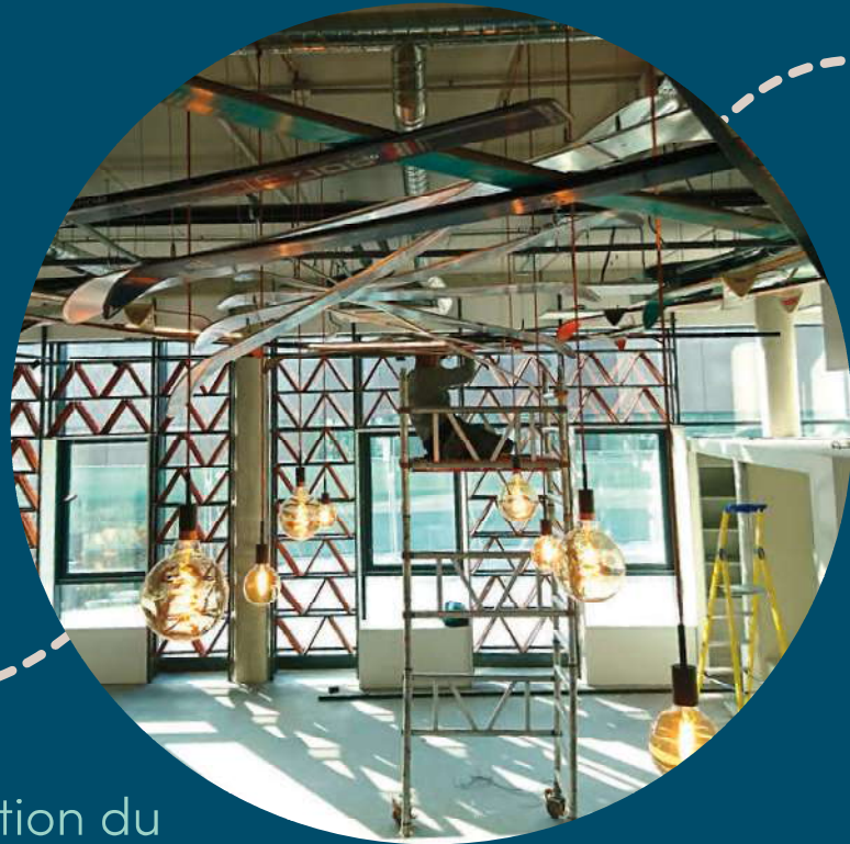
Installation du luminaire