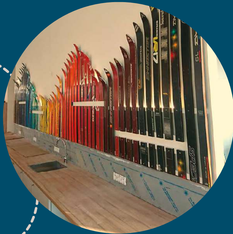
Ajout d'effets de lumière